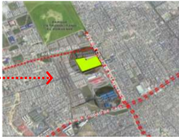
Localización Las Margaritas