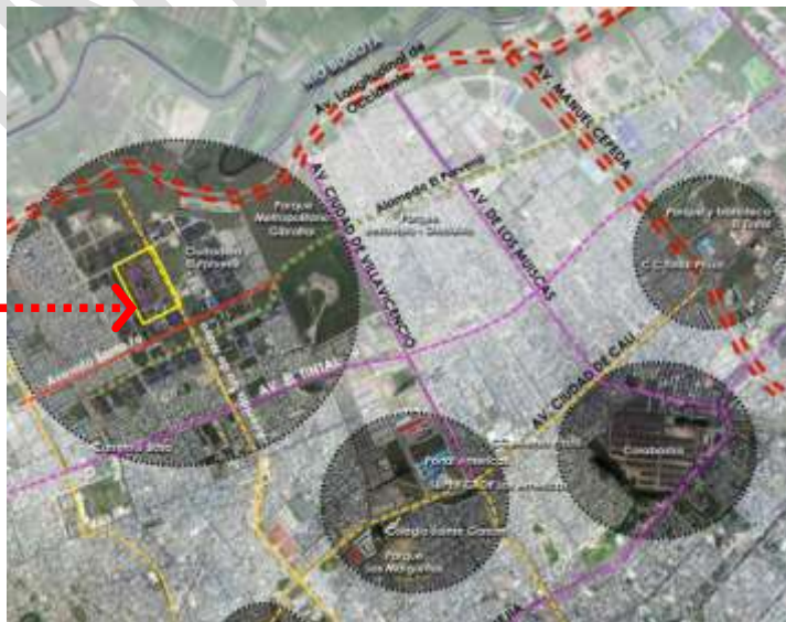
Localización Etapa VII C – Ciudadela El Porvenir –