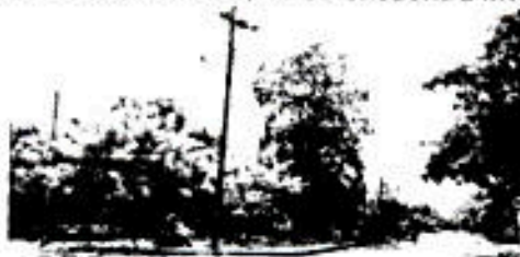
IMAGEN SOBRE LA CARRERA 15 CON 5

Que el predio localizado en la carrera 15 N° 4-96, con número predial 010001180002000, del Barrio Unidos, no se encuentra invadido, ocupado o en proceso de Terceros