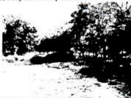
IMAGEN SOBRE LA CALLE 5