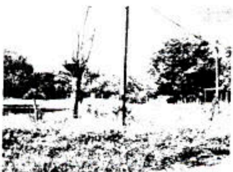
IMAGEN SOBRE LA CARRERA 16 CON 5