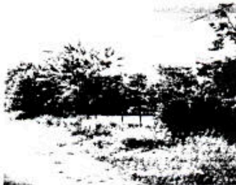
IMAGEN SOBRE LA CARRERA 16

Expedida en Sabana de Torres en el mes de junio de dos mil doce (2012)