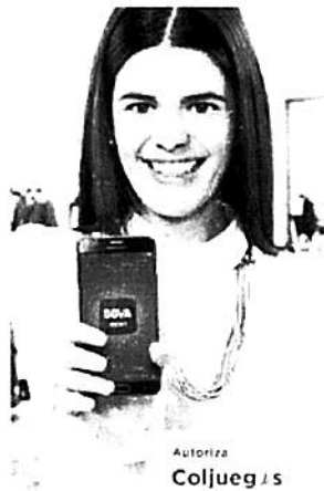
Autoriza Coljueg / s

Gánate uno de los 1.300 Samsung Galaxy J7 Prime.