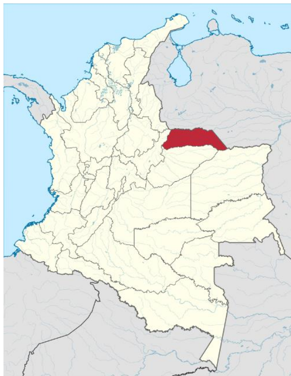
Ilustración 1. Localización de Arauca en Colombia.

Arauca está localizado entre los 06^{\circ} 02' 40'' Y 07^{\circ} 06' 13'' la latitud norte y los 69^{\circ} 25' 54'' y 72^{\circ} 22' 23'' de longitud oeste, en la región norte de la Orinoquia colombiana. Sus límites son al norte, el río Arauca que lo separa de Venezuela, al este una línea recta entre los ríos Meta y Arauca, que sirve de frontera con Venezuela, al sur los ríos Meta y Casanare, que son límites con los departamentos de Vichada y Casanare respectivamente, y por el oeste con la cordillera Oriental que lo separa de Boyacá.