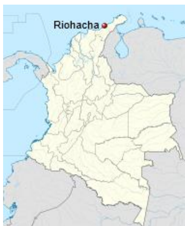
Ilustración 1. Localización de Riohacha en Colombia.