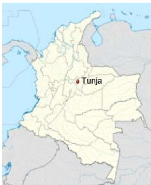
Ilustración 1. Localización de Tunja en Colombia.