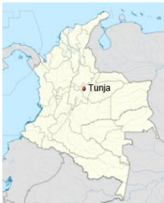
Ilustración 1. Localización de Tunja en Colombia.

Tunja alberga un conjunto monumental protegido en su Centro Histórico y declarado patrimonio de la Nación en 1959.67 A lo largo de su historia, Tunja ha sido reconocida como un importante centro literario, científico, cultural e histórico y es considerada actualmente como una ciudad Universitaria.