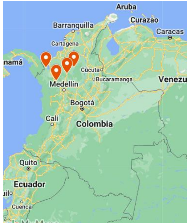
Ilustración 1. Localización de los municipios de Nechí, Cáceres, Dabeiba y Unguía, localizados en Colombia.