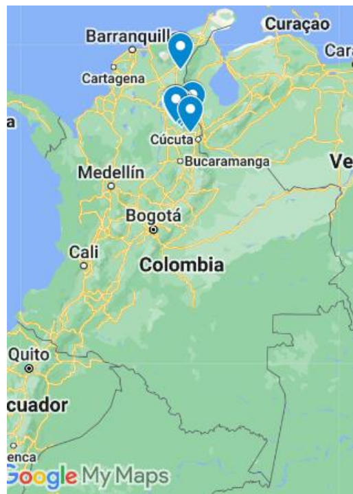
Ilustración 1. Localización de municipios en Colombia.

Lote 3: Compuesto por el municipio SAN DIEGO, ubicado en el Departamento del Cesar, es un municipio cuya dedicación está enfocada en minería y ganadería. El municipio de San Diego se ubica en las coordenadas 10.3375°N 73.1825°W. San Diego se fundó en 1609.