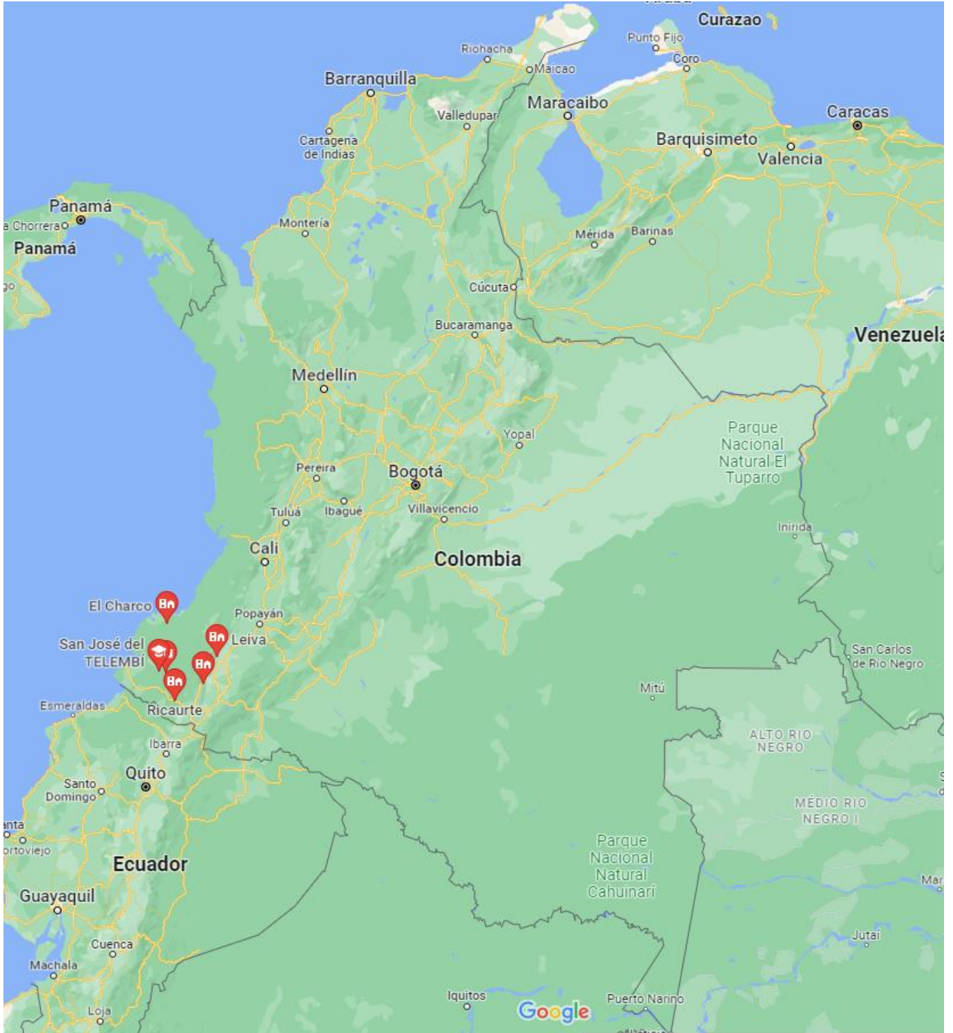
Ilustración 1. Localización de municipios en Colombia.