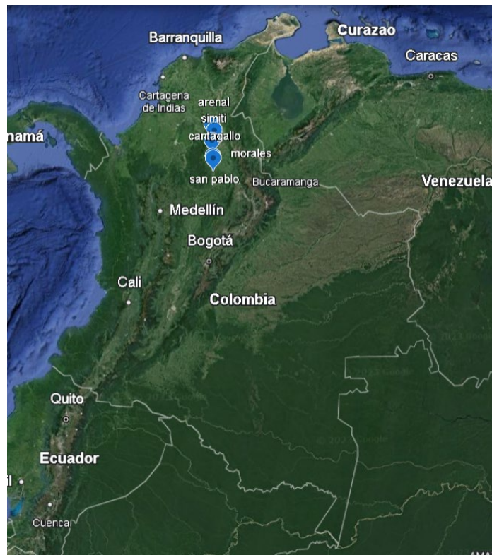
Ilustración 1. Localización de municipios en Colombia.

Territorialmente ocupa hacia el occidente un alto porcentaje de la Serranía de San Lucas, sistema orográfico del Sur de Bolívar. Su posición geográfica es la 7° 09' 00" de Latitud Norte y 75° 56' 00" de longitud. San Pablo, limita al norte con el municipio de Santa Rosa del Sur y Simití departamento de Bolívar, al sur con el municipio de Cantagallo, al oeste con Remedios y Segovia (municipios del departamento de Antioquia) y al este con el municipio de Puerto Wilches (departamento de Santander).