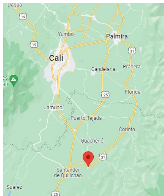
Ilustración 4. Localización de municipios