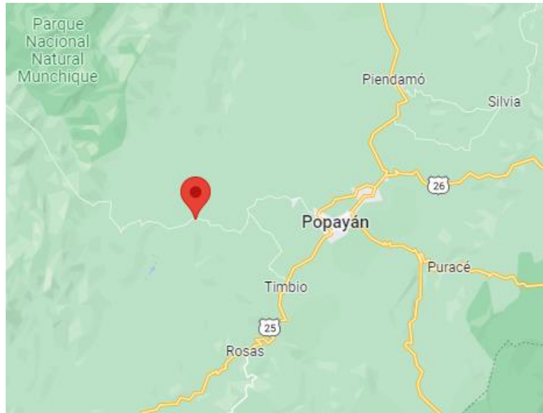
Ilustración 3. Localización de municipios