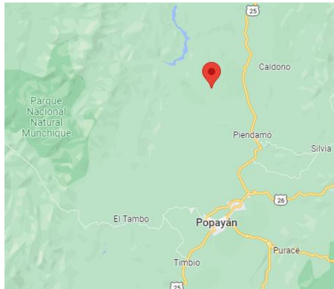
Ilustración 2. Localización de municipios