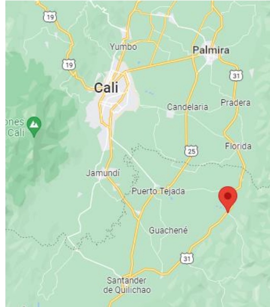
Ilustración 5. Localización de municipios