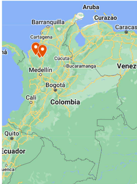
Ilustración 1. Localización de Puerto Libertador, Tierralta y Montelíbano (lote 1) en Colombia.