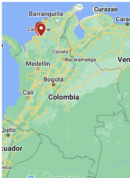
Ilustración 3. Localización de San Antonio de Palmito, Los Palmitos, Tolú Viejo y Morroa (Lote 2), en Colombia.

Lote 2: San Antonio de Palmito, Los Palmitos, Tolú Viejo y Morroa, son municipios colombianos, ubicados en el Departamento de Sucre, cuya dedicación están enfocada en la agricultura, ganadería y piscicultura. El municipio de San Antonio de Palmito se ubica en las coordenadas 9°19'55"N 75°32'32"O, a 36 kilómetros de la capital del Departamento, se fundó en 1776 y basó su economía en la agricultura, se caracteriza por la siembra del maíz, yuca, llame, frijol, plátano, frutales, etc.; el municipio de Los Palmitos, se ubica en las coordenadas 9°22'50"N 75°16'05"O, a 15 kilómetros de la capital del Departamento, se fundó en 1933 y basó su economía en la agricultura, se caracteriza por la siembra de tabaco, yuca, ñame, algodón, patilla (sandía), y otros productos agrícolas; el municipio de Tolú Viejo, se ubica al norte del departamento de Sucre en las coordenadas 9°27'07"N 75°26'22"O, a 18 kilómetros de la capital del Departamento, se fundó en 1534 y basó su economía en la minería específicamente la explotación de la piedra caliza y el municipio de Morroa, se ubica al noreste del departamento de Sucre, en las coordenadas 9°20'01"N 75°18'24"O, a 10 kilómetros de la capital del Departamento, se fundó en 1533 y basó su economía en el cultivo de productos permanentes como el plátano, el ñame y la yuca.