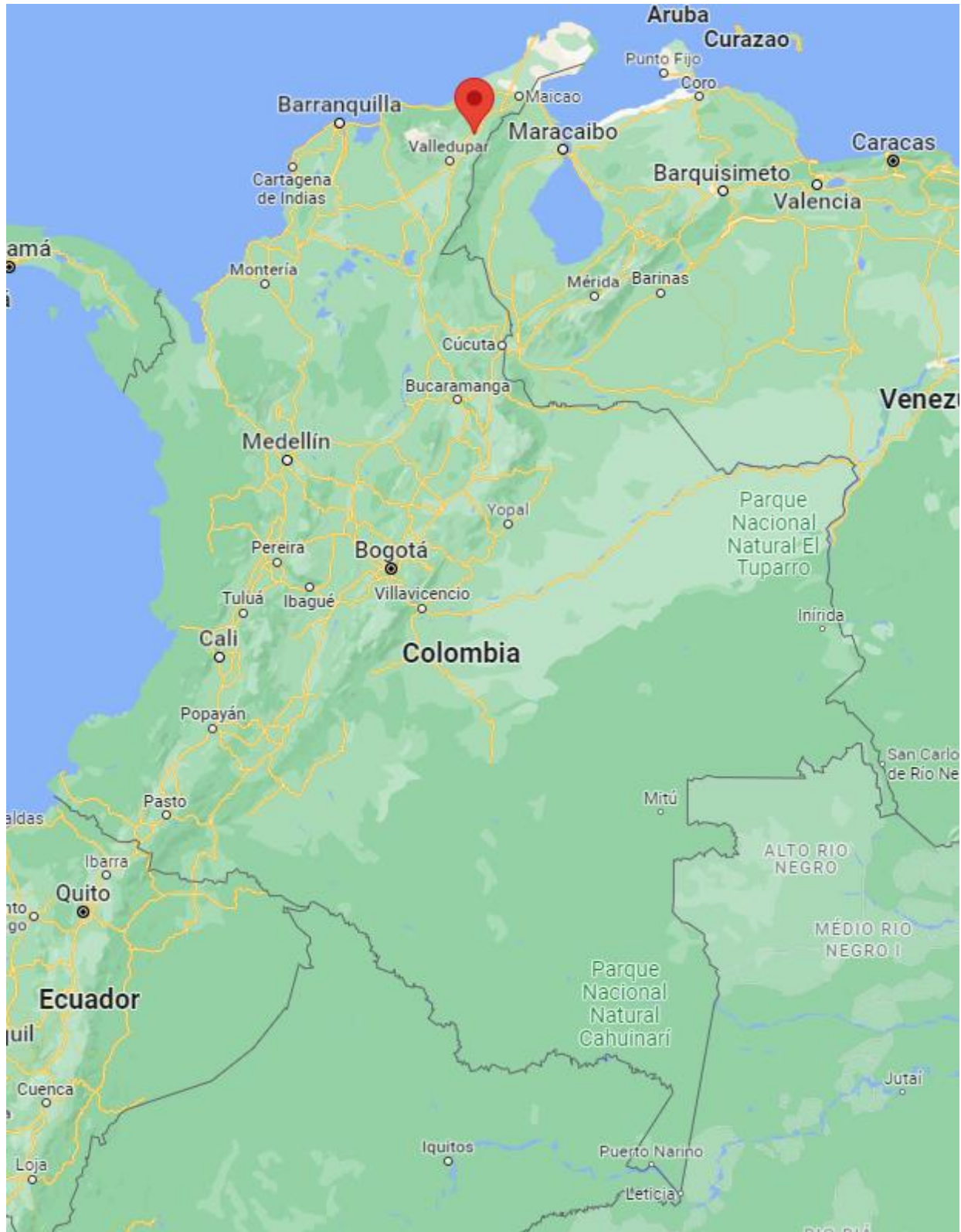
Ilustración 2. Localización de Distracción