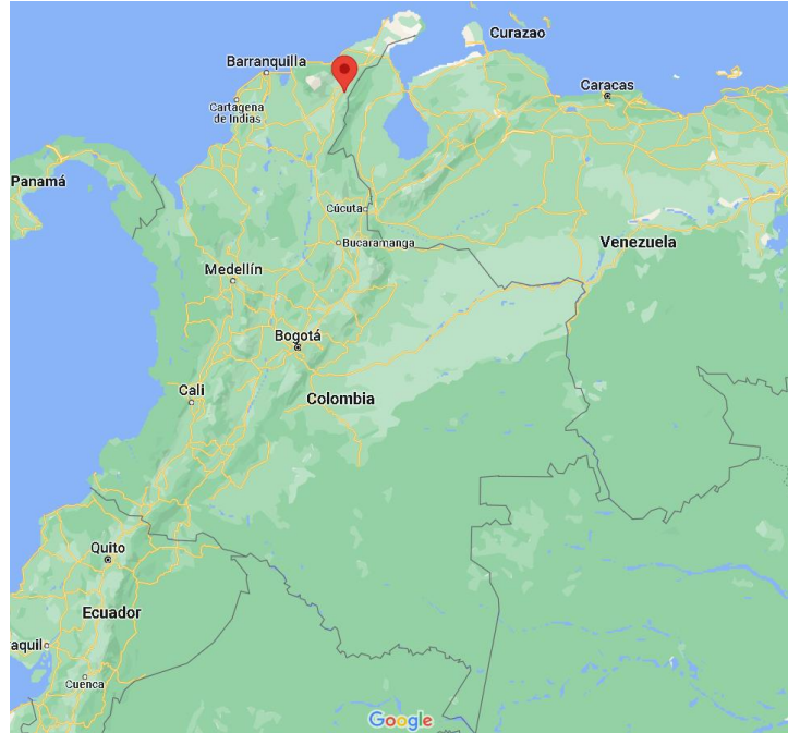
Ilustración 2. Localización de Villanueva en el departamento de la guajira