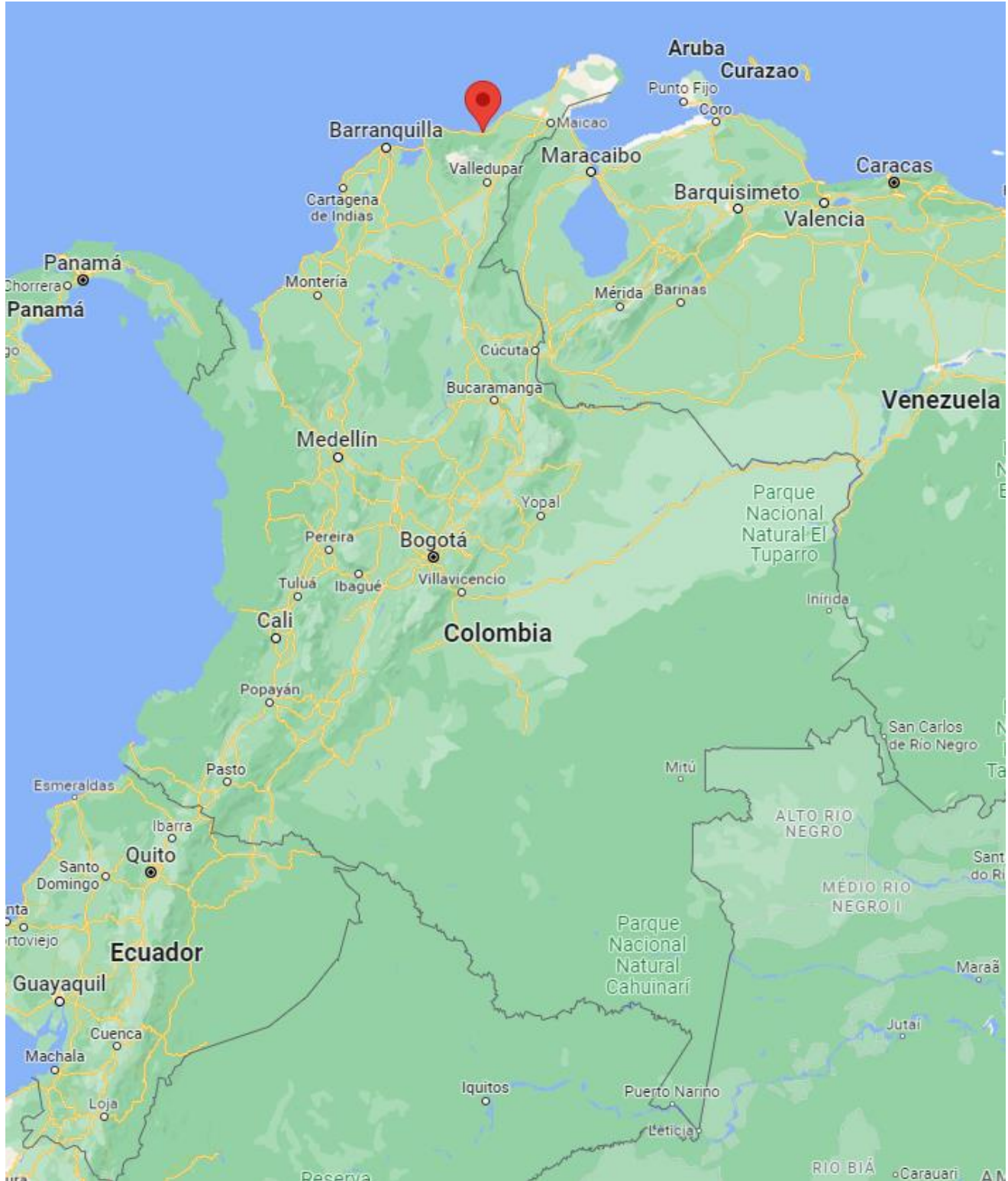
Ilustración 2. Localización de Dibulla