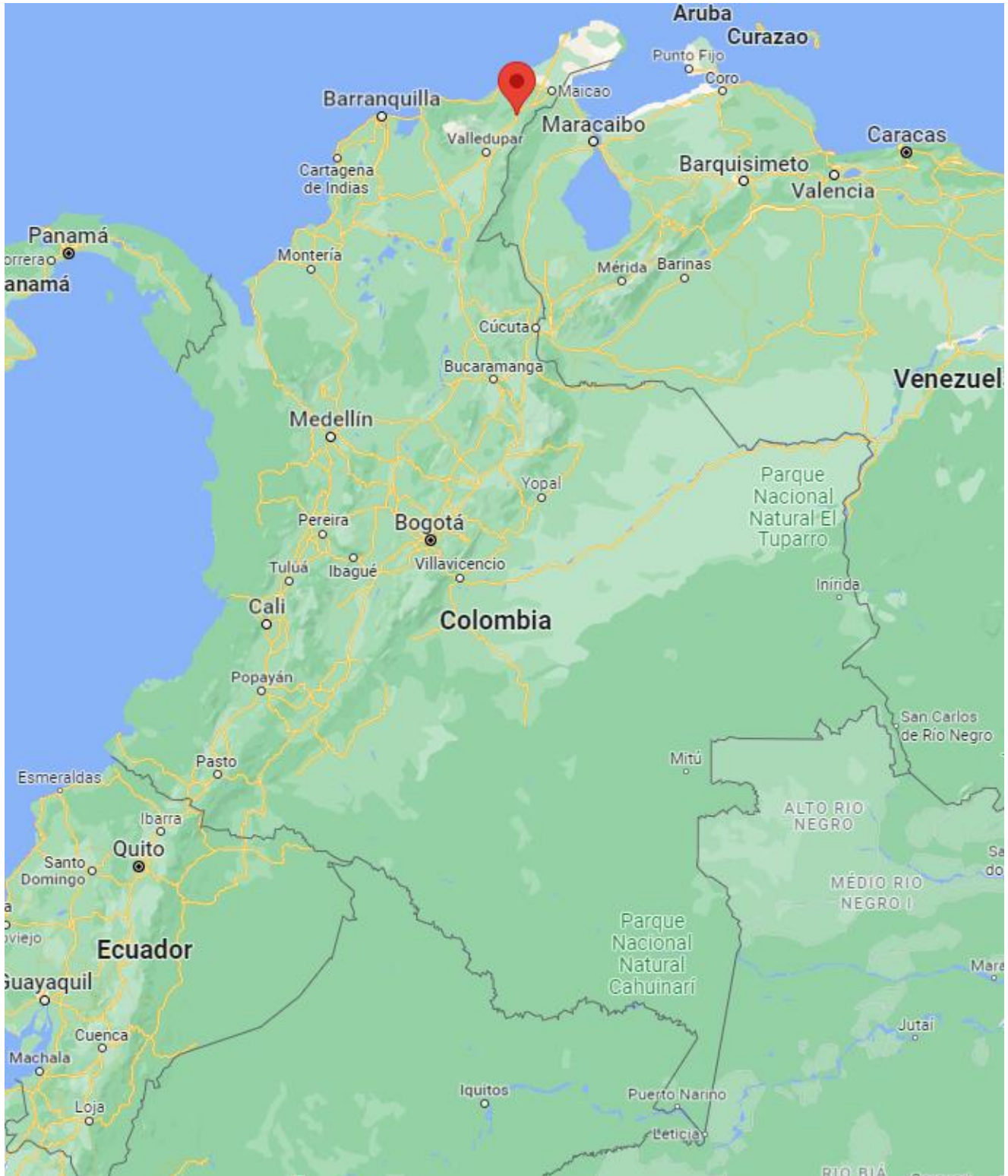
Ilustración 2. Localización de Hatónuevo