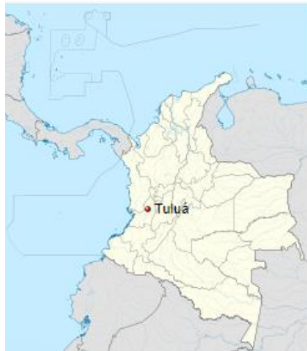
Ilustración 2. Localización de Tuluá