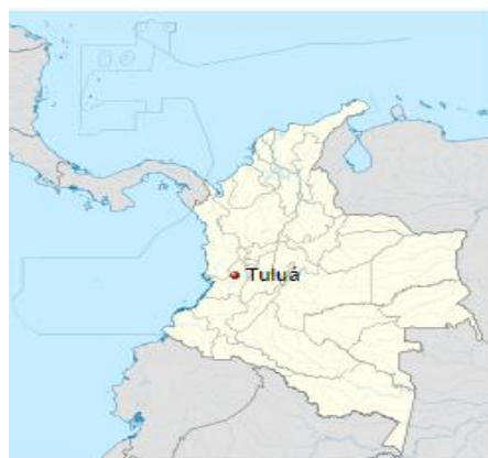
Ilustración 1. Localización de Tulúa